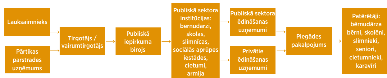
1. ATTĒLS. PIEGĀDES ĶĒDES BLOKSHĒMAS PIEMĒRS.

Ieteicams organizēt tikšanos ar galvenajām ieinteresētajām pusēm (identificētajiem resursiem) un pārrunāt lomu un pienākumus krīzes situācijā.