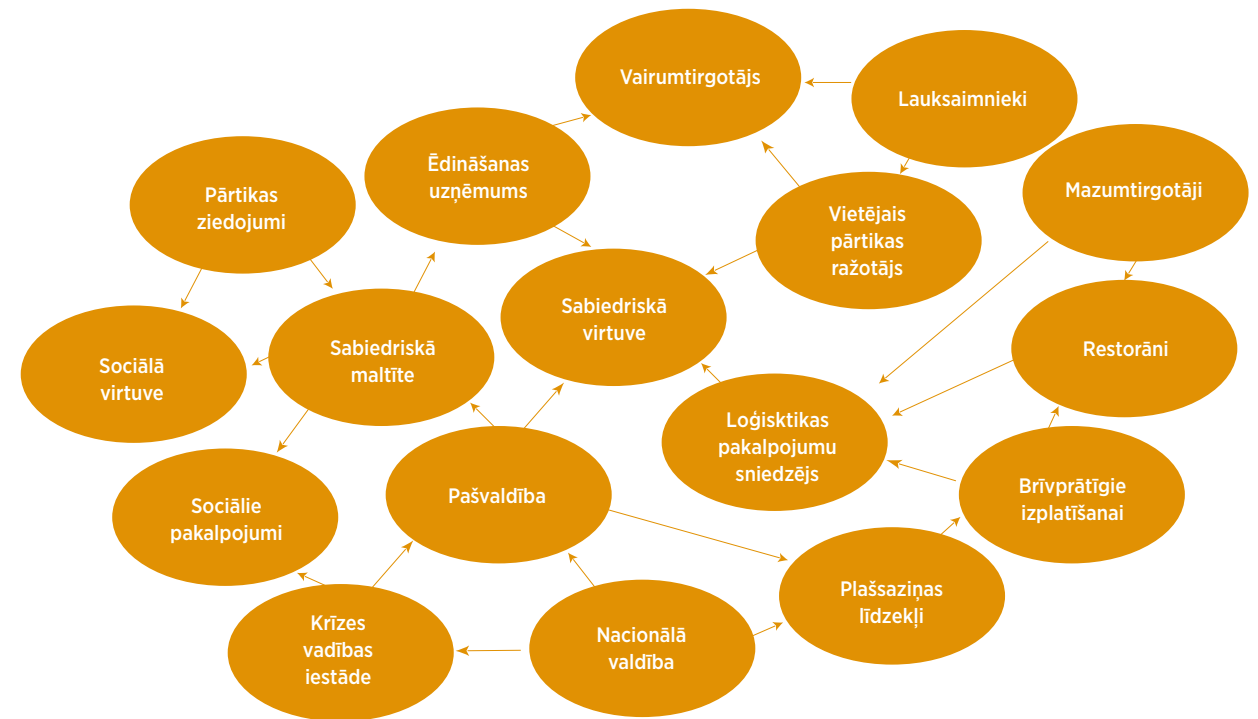
2. ATTĒLS. IEINTERESĒTO PERSONU KARTES PARAUGS, KAS CENTRĒTS AP SABIEDRISKO MALTĪTI.

vairumtirgotāji) un izplatītāji. Krīzes situācijā ieinteresēto personu tīkls varētu mainīties, iekļaujot tajā jaunus dalībniekus, vai arī varētu mainīt esošo dalībnieku lomu. Tāpēc ir ieteicams izstrādāt ieinteresēto personu karti, lai noteiktu galvenās ieinteresētās personas, kas ir iesaistītas sabiedriskajā ēdināšanā normālos apstākļos (2. attēls).